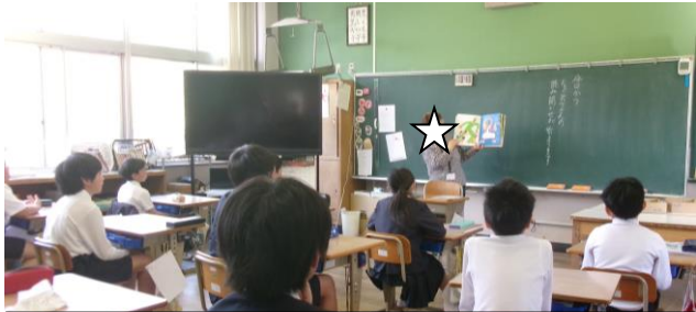
朝の読み聞かせ 聞く力 パワーアップ↑