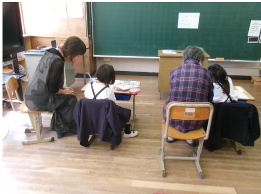
マンツーマンで手厚く学習中！

ちよこボラのみなさま いわにしネットのみなさま 地域のみなさま 河内っ子のために いつもありがとうございます