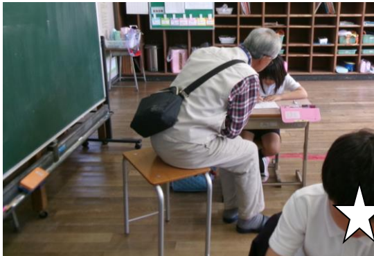
放課後学習会 わかるって楽しいね！