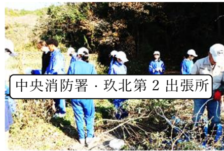
中央消防署・玖北第2出張所