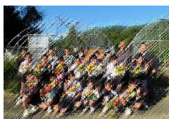
ご指導ありがとうございます