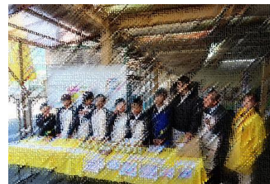
最後にみんなで記念撮影