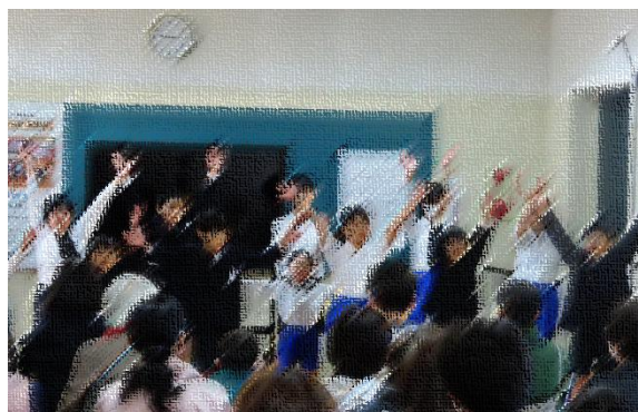
ダンスを披露する子どもたち