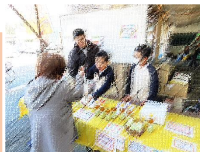
梅ハニーを販売する児童

梅ハニーづくりから販売会まで子どもたちには課題が目の前に表れ、そして課題解決のためたくさん考えたことと思います。教科書では学べないことをたくさん学んだ子どもたちでした。ご協力いただいた地域のみなさまありがとうございました。