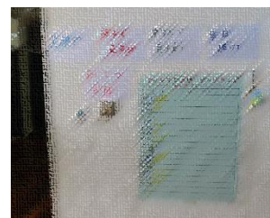
よいあいさつができたときはシールをはることに

運営委員会の児童があいさつ運動を盛り上げています。「笑顔で」「明るく元気に」「進んで目を見て」「毎日続けて」を意識してあいさつできるよう発信しています。地域で児童が良いあいさつしたときには、応えていただけるとはげみになると思います。よろしくお願いします。