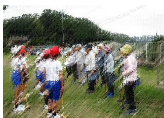
ご指導ありがとうございます

クラブ活動で地域のグランドゴルフクラブのみなさんに教えていただきながら、グランドゴルフを体験することができました。