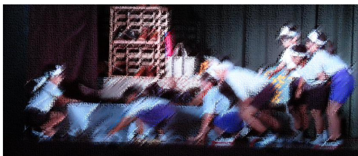
眠る靴屋さんを起こさないようにと演じるネズミグループ