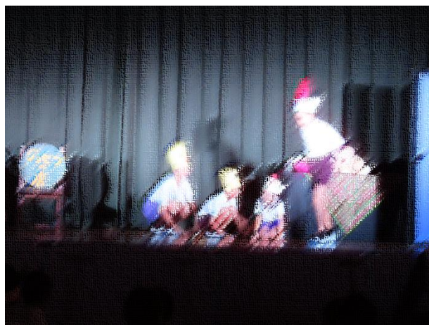
金貨について話すニワトリ・ヒヨコグループ

この劇の中で靴屋さんがもらった金貨を隠す場面があるのですが、公演当日の本番前の特別ステージでこの場面だけを切り取り、子どもたちがネコやネズミ、ニワトリやヒヨコに扮して演劇体験をしました。