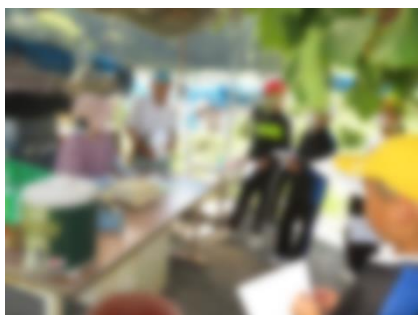
ぶどう作りの話を聞く児童