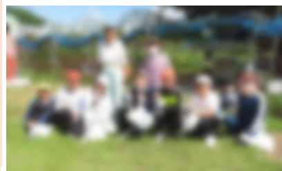
お世話になりました

当日はぶどうを育てる苦労ややりがいなども聞くことができ、キャリア教育としても学ぶことができました。ありがとうございました。