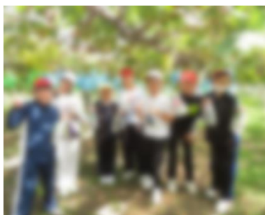
立派なぶどうをいただきました