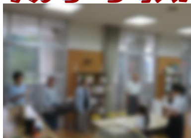
いつもご指導ありがとうございます