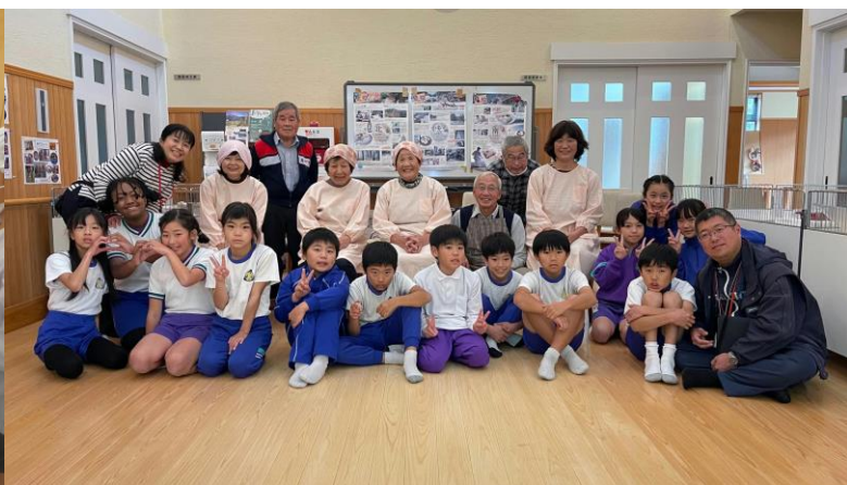
おいもパーティー(地域の方・食推さん)