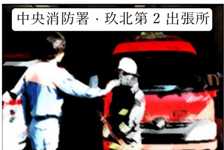
中央消防署・玖北第2出張所