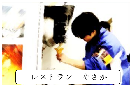
レストラン やさか