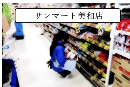
サンマート美和店