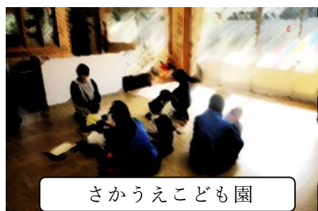
さかうえこども園

地域の9事業所のご協力を得て実施しました。生徒一人ひとりのキャリア形成にとって貴重な体験となりました。今後の進路学習にいかしていきます。ありがとうございました。