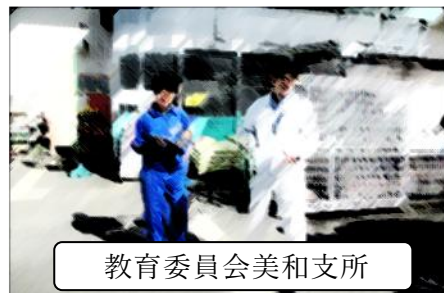
教育委員会美和支所