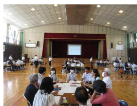
全体研修会の様子

小中一貫教育の共有の場として、由宇中学校区の児童生徒・教職員・地域の方が集い、研修会が開催されました。今年度は結愛ネット協議会とも連携し、小学生やより多くの地域の方が参加し、地域とのつながりをさらに深めるための熟議を行いました。8月18日のKRY