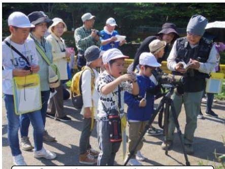
ダイサギ?アオサギ?どっち?

今回は、向峠地区での伝統のバードウォッチング、学校保健安全委員会としての救急蘇生法の学習、携帯会社による情報モラル教室等々、各方面の外部講師をお招きして学習を深めました。どの取組も、大人と子どもが一緒になって、あるいは共通のテーマで学ぶことができ、子供たちにとって大変豊かな時間を過ごすことができました。