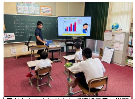
子どもと大人に分かれて情報モラル学習