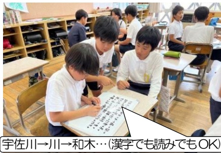
宇佐川→川→和木…(漢字でも読みでもOK)