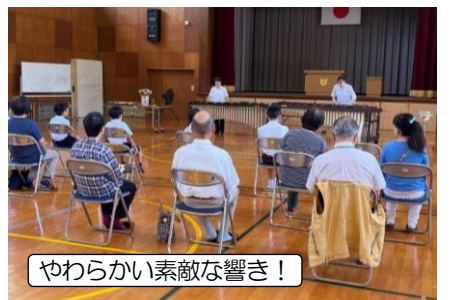
やわらかい素敵な響き!