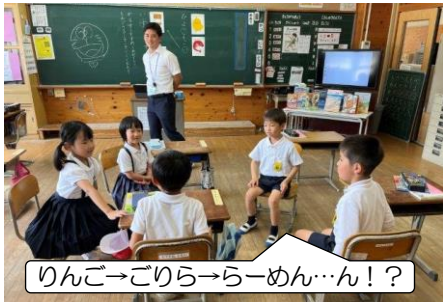
りんご→ごりら→らーめん…ん!?

眼科検診の会場となる錦清流小学校にお邪魔する機会を利用し、5月21日(火)に続いて、2回目の錦清流小との合同学習を行いました。1・6年生共に国語の学習で、「しりとり」を活用して、他者の意見を参考にしながら語彙力を高める学習となりました。多様な意見に接することができ、考えの幅が広がりました。