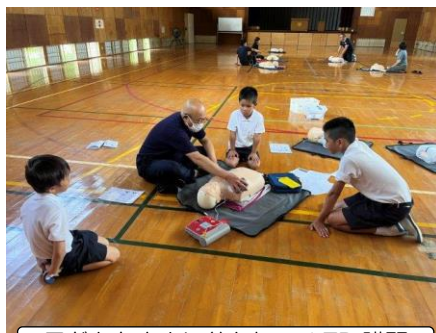
子どもと大人に分かれてAED講習