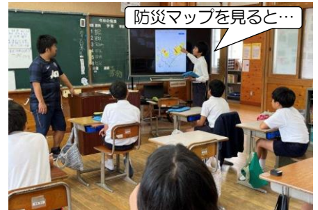
防災マップを見ると…