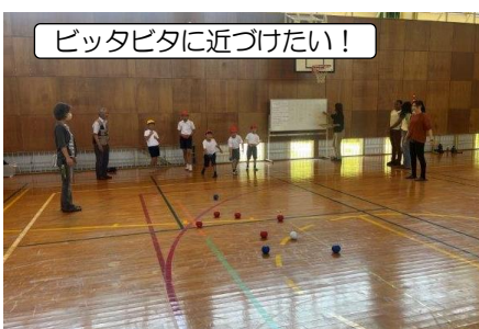
ピタピタに近づけたい!