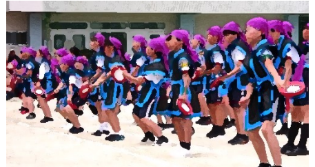
表現運動では、たくさんの観客を前に練習以上に力の入った演技が繰り広げられました!!