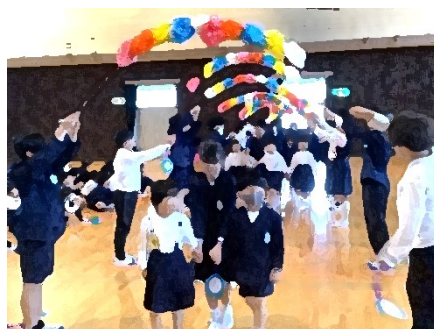
6年生のエスコートで入場

その後、全校児童で校歌を歌いました。1年生は、上級生の力強い歌声をしっかりと聞いていました。会の後半には、運営集会委員会が企画した1年生も楽しめるクイズで全校が大いに盛り上がり、正解が発表されるたびに、喜びの声があがっていました。