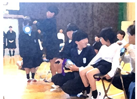
メダルのプレゼント