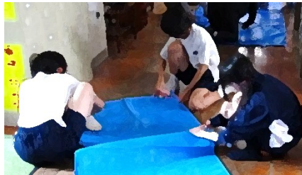
運動会に協力してくれた由宇中生徒のみなさんの様子