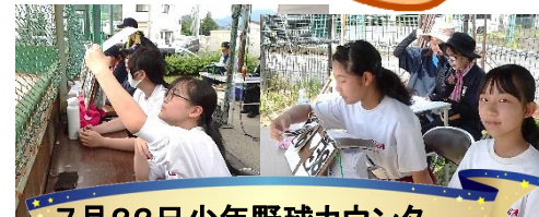
7月22日少年野球カウンター