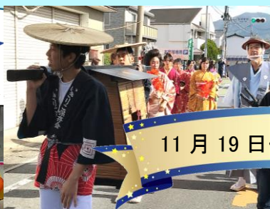
11月19日くらかけ城まつり