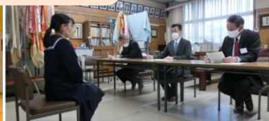
面接指導のサポート