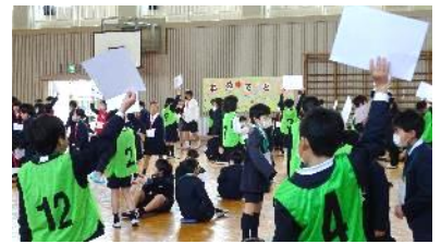
集会場所を指示する5年生

この日まで、6年生に感謝の気持ちを伝えようと、運営委員会の5年生と代表委員会の子どもたちが中心となって、アイデアを凝らした様々な企画が準備されました。1年生と手をつないでの入場、縦割り班全員で分担して作った金メダルやしおり、6年生クイズ、6年生の活躍を紹介する動画、教職員からのビデオレターなど、一つ一つの企画に、6年生に対する下級生の思いが込められていました。