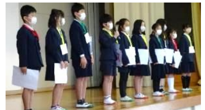
クイズを進行する5年生

企画の中には、6年生と自由におしゃべりをする時間、みんなで校歌を歌う時間も設けられ、最後の思い出づくりに込めた子どもたちのやさしさが伝わってくる、温かい集会となりました。