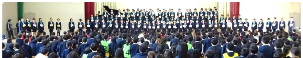
6年生からの歌のサプライズプレゼント