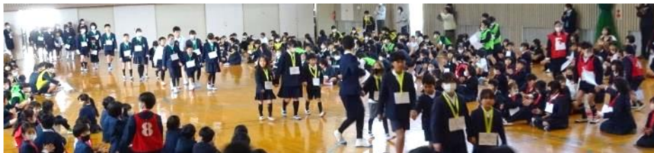
1年生と手をつないでの入場