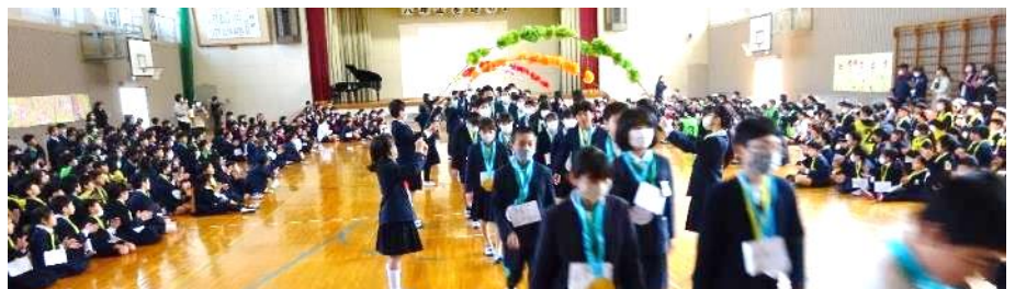
大きな拍手の中での見送り「6年生のみなさん、ありがとうございました」