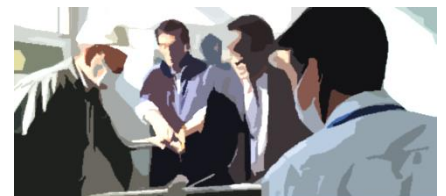
不審者対応訓練の様子