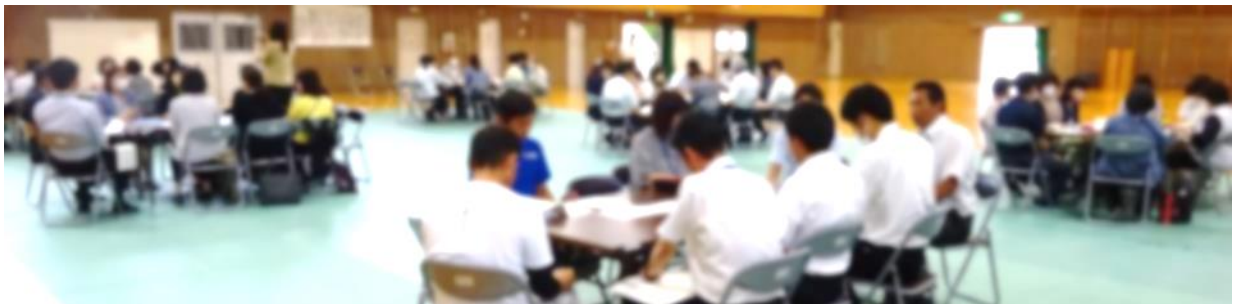
各部会での熟議の様子（第1回研修会）

平田小中の体力面での課題を共有して、その課題の改善を図る運動メニューや・よりよい運動習慣づくりを進めています。