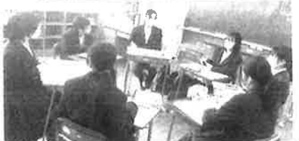
1/5(金)リーダー研修会の様子

私はこれから1年間執行委員として、この岩国西中学校をよりよくしていきたいと思っています。具体的に、地域の方との交流、清掃活動、ボランティア活動など、他にもさまざまなことに取り組んでいきたいです。