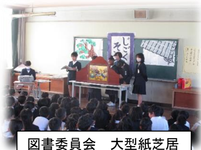
図書委員会 大型紙芝居