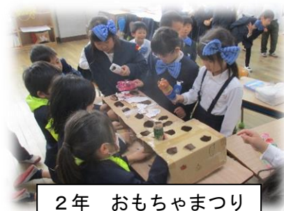
2年 おもちゃまつり