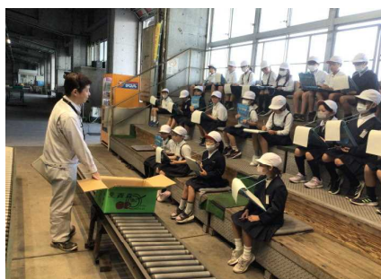
3年岩国市内諸施設