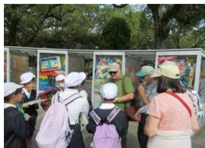
5年平和公園・マツダミュージアム