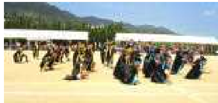
〈3, 4年生 中洋ソーラン〉