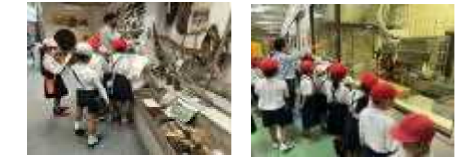
〈3年 由宇歴史民俗博物館他〉 〈1,2年 柳井 菓子乃季他〉