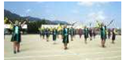
〈5, 6年生 エイサー〉