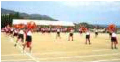
〈1, 2年生 花笠音頭〉

9月30日に実施した運動会では、前日準備、当日の後片付け等大変お世話になりました。おかげさまで児童は練習の成果を発揮し、最後まで一杯頑張る姿を披露することができました。早いもので2学期も振り返り点を過ぎ、秋真っ只中。秋は児童にとって、勉強に、運動に、生活面に、たくさんのことを吸収して大きく成長することのできる「実り多き季節」です。ともに、子どもたちの力を伸ばしていきましょう。