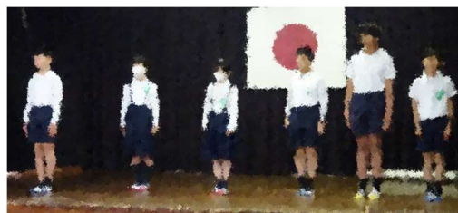
「10月全校朝会 素読発表会」