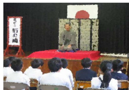
「由宇亭拓の輔 様 人権講演会」

河内っ子は、児童会活動「河内小サミット」で「河内小をよりよくする」を合言葉に、抜群のチームワークで話し合い活動に取り組み、みんなが温かい仲間の輪(和)をどんどん広げて成長しています。2学期のゴールを「ぴかぴかに成長した姿」で迎えることを期待しています。