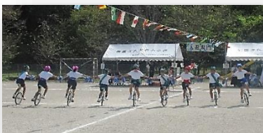
秋季運動会 ～ 一輪車