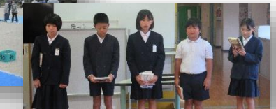
ふれあい朝会 ～ 本の紹介