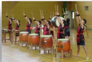
柱野ふれあいスポーツフェスタ ～ 柱野太鼓他