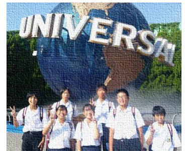
【ユニバーサルスタジオジャパンにて】

2年生は、地域の事業所の皆様のご協力を得て、職場体験学習を行いました。2日間の体験でしたが、「自分にふさわしい仕事とはどんな仕事か」「仕事のやりがいとは何か」など考え、働くことへの視野が広がるきっかけとなったことでしょう。