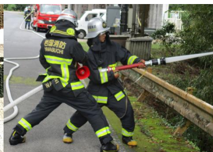
【消防署玖北第一出張所】