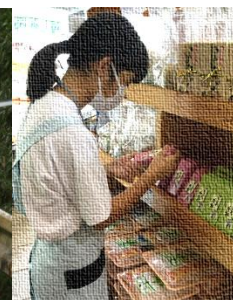
【ピュアラインににきき】