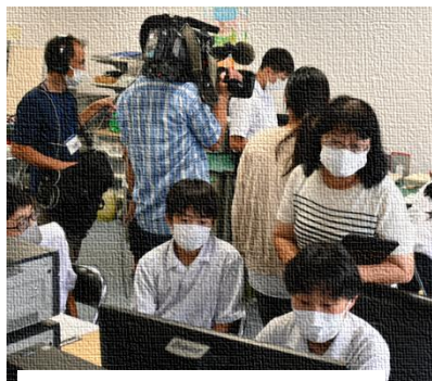
【映像ライブラリーで映像収集】