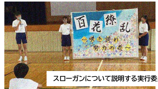
スローガンについて説明する実行委員