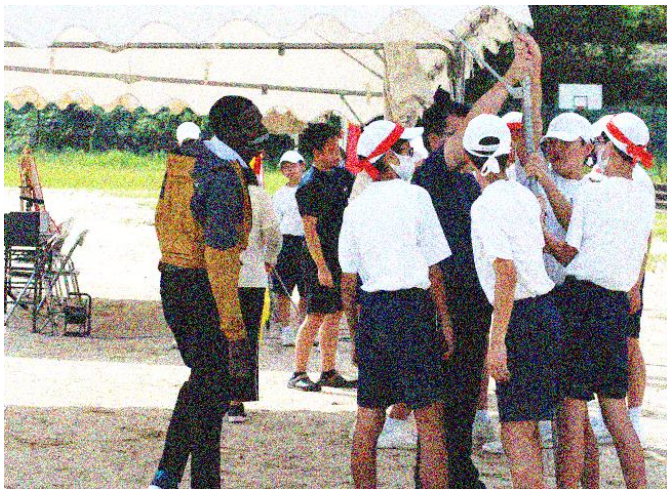
《体育祭練習の様子》

気付いて、考え、すぐに行動できる本校自慢の生徒たち。「笑顔にさせていただいた」そんなすばらしい光景でした。