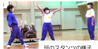
班のスタンツの様子