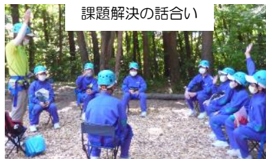
課題解決の話合い