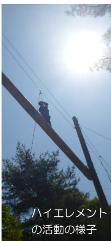
ハイレメント の活動の様子