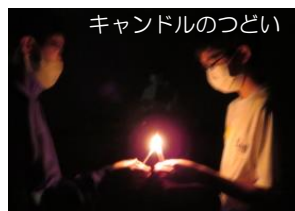
キャンドルのつどい