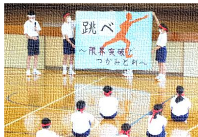
【スローガンを発表する生徒会執行部】

夏休み中、3年生を中心に応援練習とダンス練習を重ね、2学期に備えました。全校ダンスの練習では、3年生が1・2年生に本番で踊るダンスを披露しました。その後、ソーシャルディスタンスを保ちながら、縦割りの5班に分かれて練習をしました。3年生の教え方が上手で、1・2年生は、あっという間に振り付けを覚えました。当日、笑顔いっぱいの全校ダンスにご期待ください。