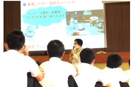
【薬物乱用ダメ。ゼッタイ。教室】

7月2日(金)、健康福祉センターから講師をお招きし、「薬物乱用ダメ。ゼッタイ。教室」を行いました。薬物使用のニュースなどを参考にして、薬物が心身に及ぼす影響について学びました。また、シンナーを使用した実験では、発泡スチロールを脳に見立て、シンナーに浸すことによって発泡スチロールが収縮する様子を観察しました。脳も同様に萎縮して元に戻らないことを知りました。