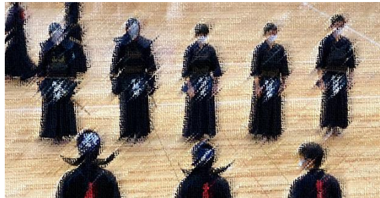
【2日目、試合に臨む選手】