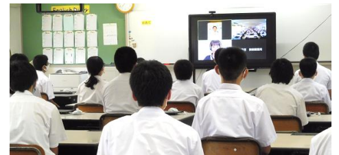
【ZOOMを使用したスマホ安全教室】

また、7月6日(火)には、「スマホ安全教室」をオンラインで行い、SNS やインターネット使用における危険性やその対処法などを学び、正しく使う意識を高めました。