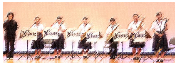
【錦ふるさとセンターでの前日練習の様子】