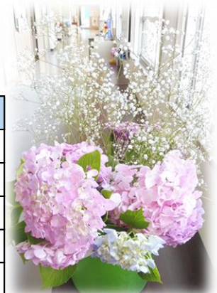
【贈:地域の方】 ♡いつも、ありがとうございます！