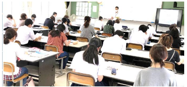
【通知表の評価の在り方について説明する校長】

各校長先生は、自校の特色ある活動や取組等を分かりやすく説明してくださり、生徒は興味深く聞いていました。