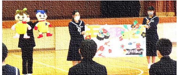
【「ほたみ」と「ほたろう」の紹介の様子】

次に、新入生の最も関心があることの1つである部活動紹介の場面では、先輩の迫力ある練習や演奏の姿に新入生が圧倒される様子も伺えました。総合文化部(制作)の紹介では、本校のマスコットキャラクターの「ほたみ」と「ほたろう」の紹介もありました。