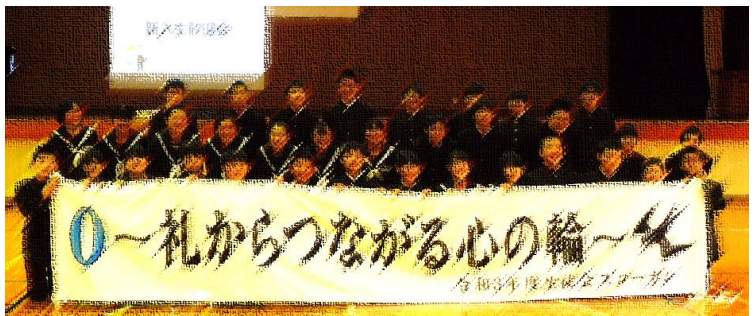
【撮影時のみマスクを外して、ニッコリ笑顔で撮影】

生徒会執行部を中心として行ったこの度の会では、在校生の「新入生を心から歓迎したい」という気持ちが随所に表れていて、今年度の生徒会活動が主体的で充実したものとなる期待感を大いに抱かせる会となりました。