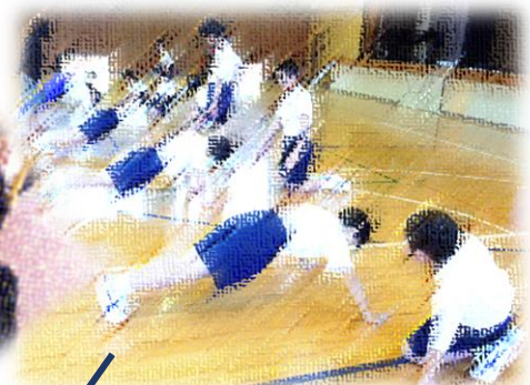
1年生の保健体育 正しい姿勢で運動