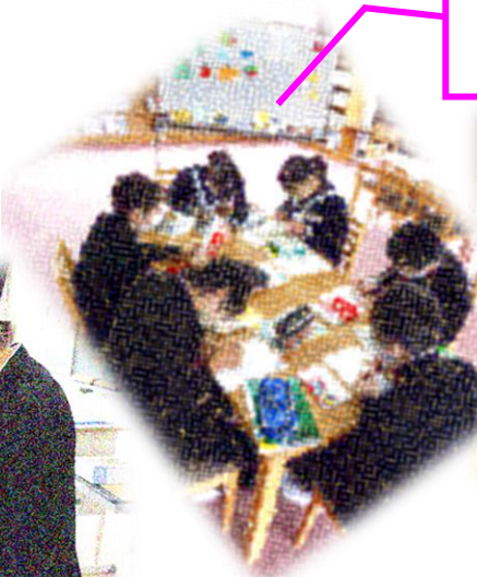
2年生の国語の授業 本のポップ作りの様子