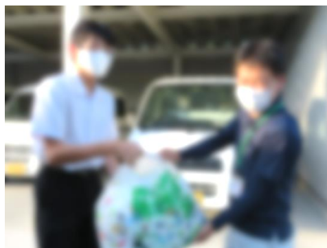
ペットボトルキャップを渡す

これからも生徒会を中心に、あいさつ運動やペットボトルキャップの寄付など、地域の中で中学生ができることを考え実践していきたいと考えています。生徒の健全育成のため、今後ご協力をお願いします。