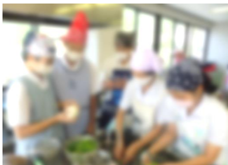
グループで協力して料理に取り組む

10月6日（火）岩国市食生活改善推進協議会の方のご協力により、2年生が錦保健センターにおいて料理教室を実施しました。