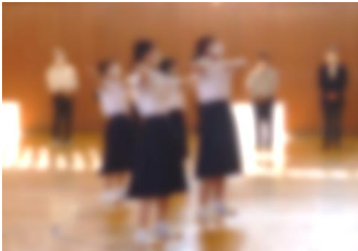
県体壮行式の様子