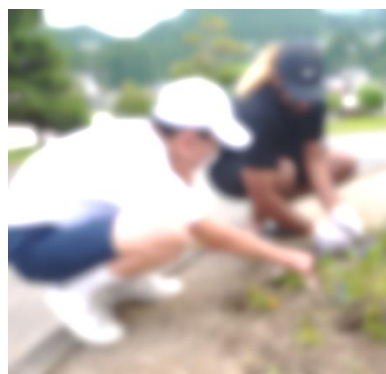
6月9日環境美化活動の様子

清掃は、その成果が見えやすい活動であると思います。生徒会が中心となり、生徒一人ひとりが意識をもって清掃に取り組み、すがすがしい錦中学校となることを楽しみにしています。