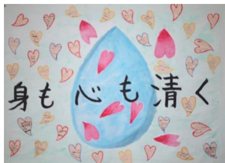
掲示された本年度の生徒会スローガン

ちりばめられた小さなハートには、一人ひとりの取り組む目標が書かれています。テーマからほとんどの生徒が、学校や家庭の清掃活動に目標を置いています。