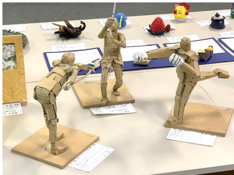
出品された立体表現の作品

1月17日(金)～19日(日)に、和木美術館において、岩国・和木学校美術展覧会が開かれました。