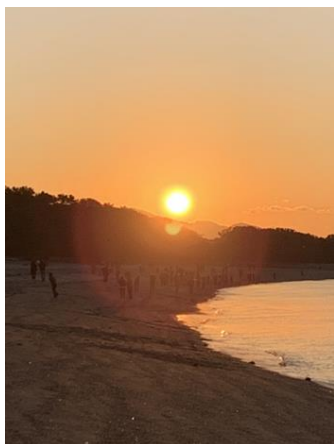
自宅近くから見た初日の出

https://www.edu.city.iwakuni.yamaguchi.jp/site/