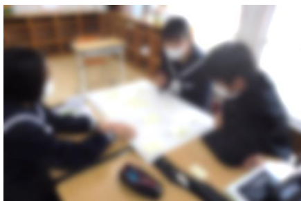
リーダー研修会の様子

冬休み中の12月25日（水）、1月6日（月）の二日間、新生徒会役員が、リーダー研修会を開き、さっそく活動をはじめました。