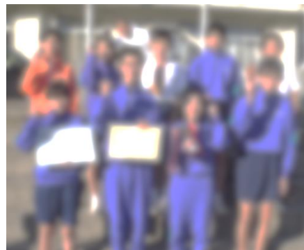
優勝したチーム「ジョーカー」

また3年生にとっては、中学校最後のスポーツマッチとなりましたが、学年の分け隔て無く皆が笑顔で過ごすことができた貴重な時間となりました。