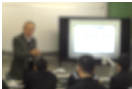
心の健康教室の様子

12/20(金)コンピュータ室において、スクールカウンセラーによる「マイナスの感情と上手にお付き合いする方法」というテーマで、第2回心の健康教室を実施しました。