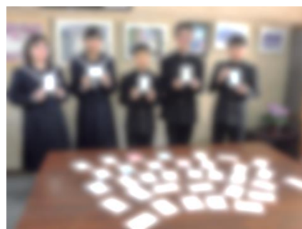
12月18日 愛の年賀状を送る運動

「ONE TEAM」は、どんな強豪チームでも選手たちの思い、心が一つにならなければチームとして機能しないという、ジェイミー・ジョセフヘッドコーチが掲げたテーマでした。その結果、7ヶ国15人の海外出身選手を含む31人はリーチマイケル主将を中心に桜の戦士 ONE TEAMとして結束し、快進撃を続け、日本列島を熱狂の渦に巻き込んだことは、ご存じの通りです。