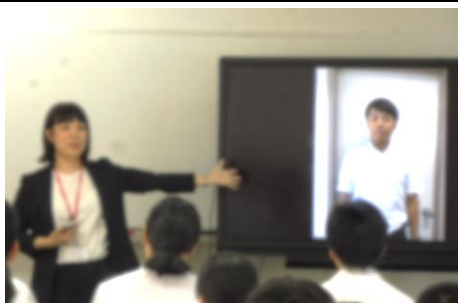
情報モラル教室の様子