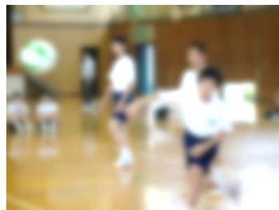
生徒の企画によるスポーツマッチ