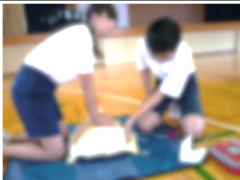
心肺蘇生の練習の様子

7月9日（火）全校生徒を対象に救命救急講習会を実施しました。日本赤十字社山口県支部の方2名を講師としてお迎えし、心肺蘇生の手順や方法、AEDの使い方などについて指導を受けました。