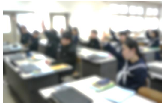
1年生 英語の授業の一コマ

さて、朝、生徒の登校時間に学校の下の押しボタン信号機のところに立っていると、集団登校している小学生や本校の多くの生徒が、 遠くから元気よく「おはようございます」とあいさつ をしてくれます。小学生の中には、さらに加えて「 いってきます 」と添えてくれる児童もいます。