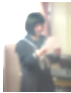
お礼を述べるSさん