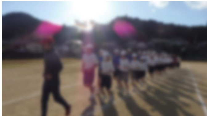
【走ることの基礎・基本を学びました】