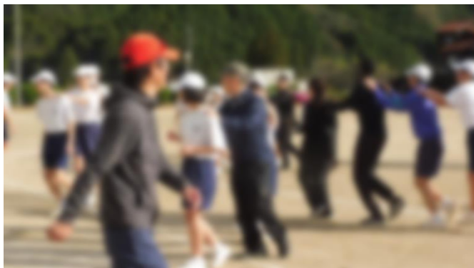
【楽しく走ることを学びました】

今回学んだことを生かして、12月2日(土)の「錦町小中学校持久走大会」は自己ベストをめざすとともに「笑顔」で走ることで地域のみなさんや保護者のみなさんに「元気」を届けたいと思います。保護者のみなさま、地域のみなさま、ご声援をよろしく願います。