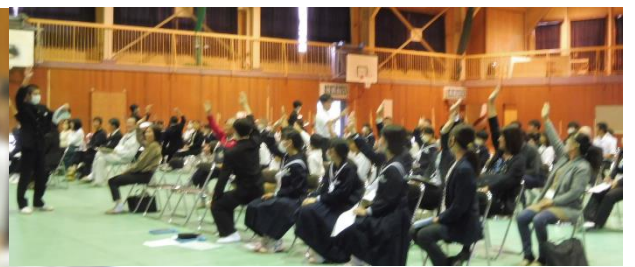
↑【意見を出し合った後、多数決で決めました】