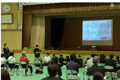
↑【グループでの意見を中学生が発表】

錦・美川地区が盛り上がるとともに清流線が存続するよう願いを込めて千羽鶴を折ります。保護者のみなさま、地域のみなさま、12月2日(土)の錦町小中学校持久走大会終了後、錦清流小学校体育館で千羽鶴を折りますので、ご協力よろしくお願ひします。