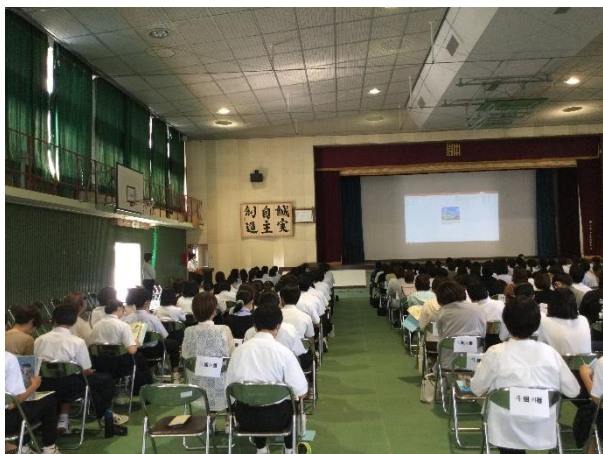
高校説明会の様子

こうした情報をきちんと知り、実際に自分の目で確かめ、将来を具体的に考える時期がやってきました。毎日の勉強も不可欠です。期末テストは終わりましたが、毎日決まった時間に机につき、1年時からの復習に励んでほしいと思います。受験勉強は大変ですが、皆で励まし合い、日々の授業を大切にしてほしいと願っています。