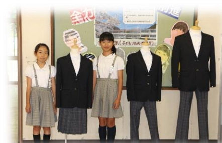
来年度中学1年生の制服