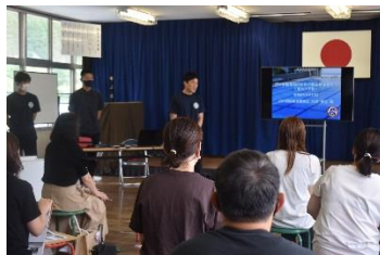
<プール監視員のための救急救命講習会>

◎山口消防防災探究会のみなさんから、溺れる原因やプール監視の方法、事故時の対応の仕方を学びました。