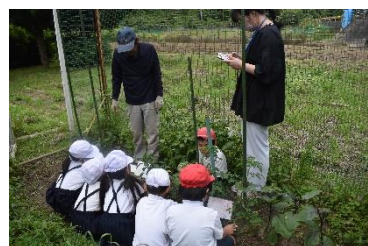
<野菜作りのプロから>