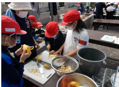
<自然教室 由宇ふれあいパーク>