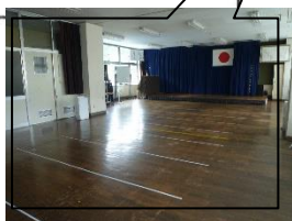
体育館の代わりに、式や集会、雨天時の体育をここで行います。