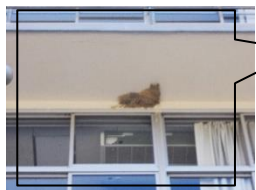
毎年ツバメがやってきます。子どもがいる教室の壁に、巣を作るのはさすが必要です。