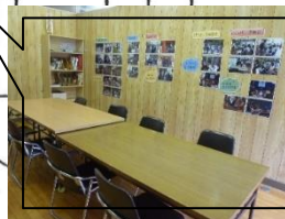
保護者や地域の方が気軽に集まって話したり、学習会をしたりしています。