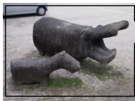
卒業記念の「カバさん」 杭名小学校のシンボルマークの一つです。