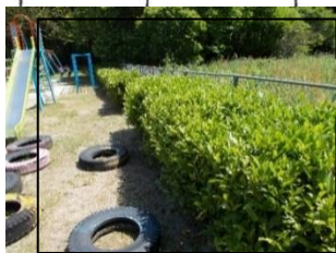
卒業記念の「お茶の木」 毎年茶摘みをしています。「杭名茶」を楽しむお茶会も開いています。