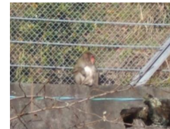
国道を挟んだ斜面では時々サルがひなたぼっこをしています。