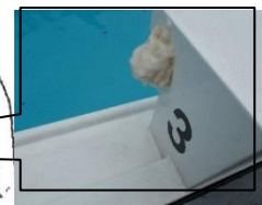
昨年はモリアオガエルが卵を産みました。今年も産卵に来るかな？