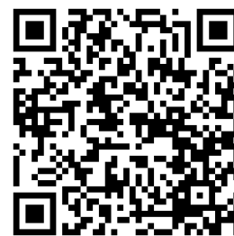
「ヒヤリハットマップ」QRコード