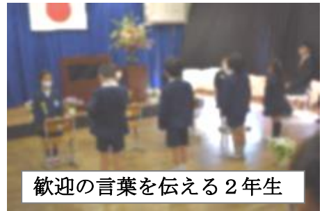
歓迎の言葉を伝える2年生

参観日の後、しっかりとした文字が書けている児童の様子をほめていただきました。昨年度までの成果の上に、確実に力をつけていると児童自身が実感できるように取り組んでまいります。「 自分は、時と場に応じた言動ができる 」「 自分は、授業がよく分かる 」と言える児童を増やしていくことをめざします。コロナも一段落し、今後は、人とのかかわり、たくさんの体験、幅広い学びの機会、めあてをもって取り組んだり振り返ったりする活動をより多く重ねていくつもりです。これまで以上に地域の方々、地域のものの力を一つでも多く児童に、と願っています。どうぞよろしく願いいたします。