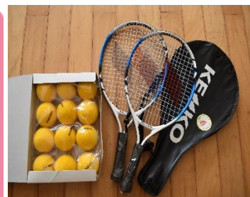
ラケットテニスセット

ベルマークを集めると、「自分たちの学校に必要なもの」が購入できるとともに、その購入金額の10%が「教育環境の乏しい学校や被災して困っている学校」に通う子どもたちの支援活動等に使われるそうです。昨年度は、集まったベルマークでラケットテニスを購入しました。今年度もご協力お願いします。