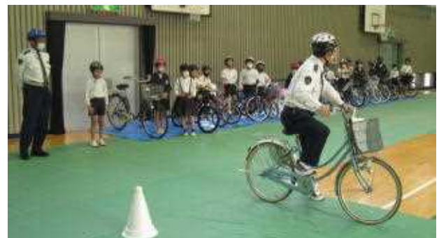
【4月20日 4年 自転車教室】