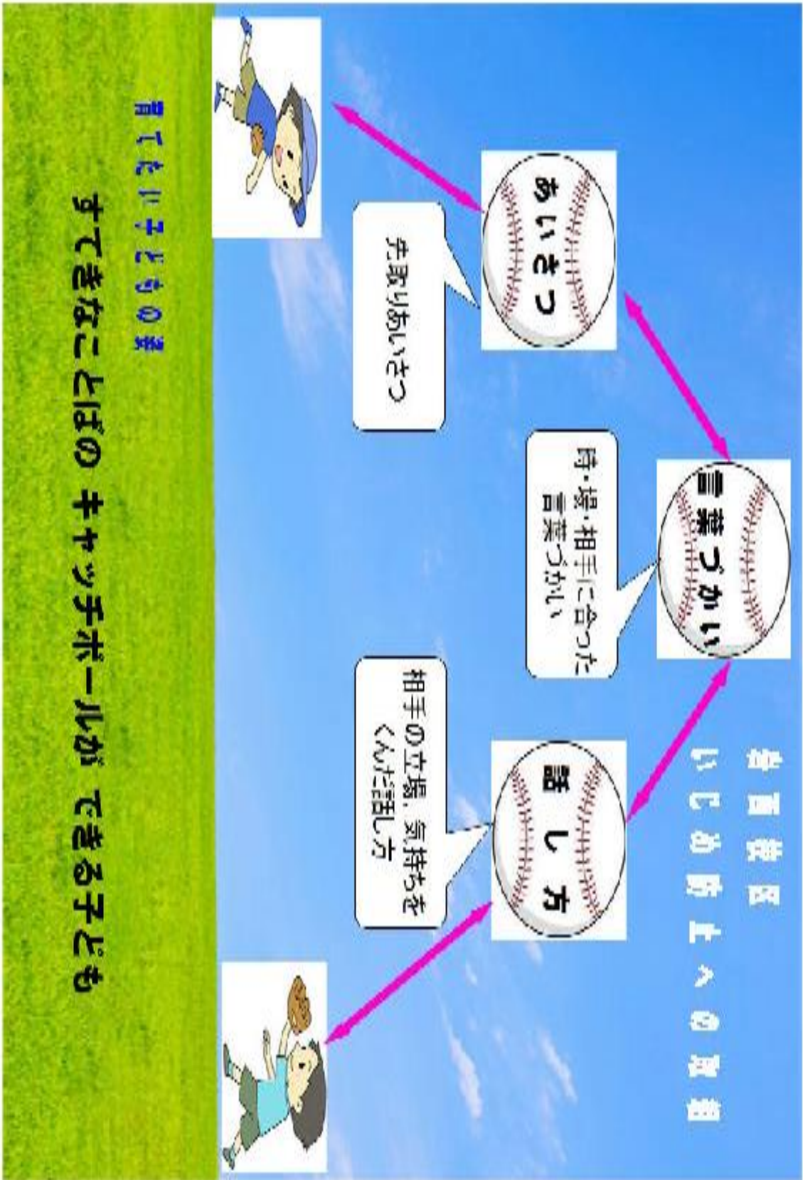
資料添付1：岩西校区いじめ防止への取組