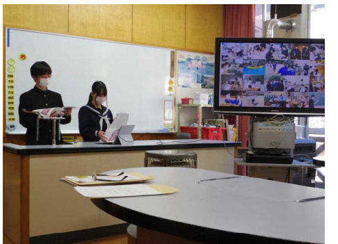
2月16日(木) 錦中学校 入学説明会 中学生による素晴らしいプレゼンでした。