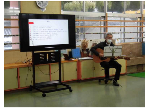
2月1日(水) 月はじめの会 表彰・児童・教職員による発表がありました