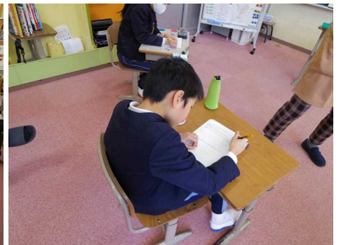
2月16日(木) 人権教育参観授業 性の多様性について知り、人権尊重の大切さを学びました。