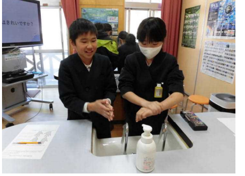
2月16日(木) 学校保健安全委員会 「ばいきんさようなら大作戦」