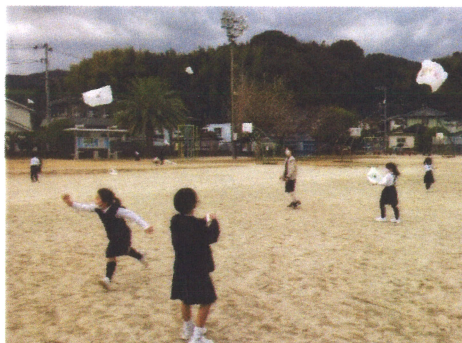
「たこ たこ 上げれ！」(1年生)