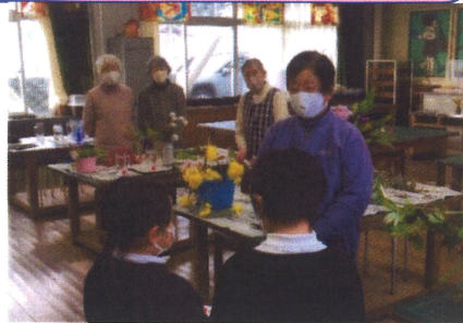
6年生と2年生からお礼のお手紙