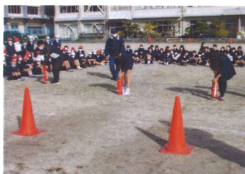
「火の用心！」火災避難訓練