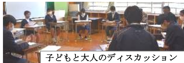
子どもと大人のディスカッション