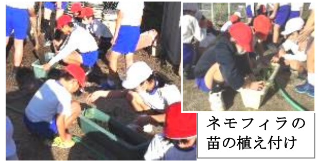
ネモフィラの 苗の植え付け

「運動会」「音楽会」「持久走大会」。行事に向けて個人でがんばったり集団で取り組んだりする中で、心身ともに大きく成長した2学期でした。本番は限られた時間ですが、そのできばえや心身の充実に何より大切なのは、そこに至るまでの小さな心遣いや努力の積み重ねです。11月中旬には、花の苗の植え付けをしました。土づくりから水やりや施肥、寒さの中で育つ植物を世話する体験からも多くのことを学びます。