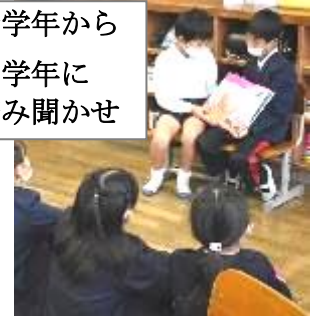
低学年から 中学年に 読み聞かせ

「人」のことを想って行動する本校児童。「願い」をもって根気よく努力し、喜んでもらえることをうれしく思う本校児童。もっともっと地域の方々とともに過ごしてほしい、そして、地域の宝をたくさん見つけ大切にしていってほしいと願っています。11月19日には、参観日を利用して、地域の風物やイベント、体験アイデアなどについての保護者話し合いの時間をもちました。25日には、地域との交流やPRの仕方を議題に、高学年児童が中学生や地域・保護者の皆さんと話し合うディスカッションを行いました。自分のしたいことや自分だからこそできることなど、小さな一歩を大切に進めるための取組を進めていきたいと思えます。