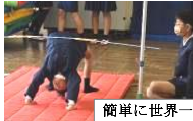
簡単に世界一になれるゲーム(略称「かんせか」)

「人」のことを想って行動する本校児童。「願い」をもって根気よく努力し、喜んでもらえることをうれしく思う本校児童。もっともっと地域の方々とともに過ごしてほしい、そして、地域の宝をたくさん見つけ大切にしていってほしいと願っています。11月19日には、参観日を利用して、地域の風物やイベント、体験アイデアなどについての保護者話し合いの時間をもちました。25日には、地域との交流やPRの仕方を議題に、高学年児童が中学生や地域・保護者の皆さんと話し合うディスカッションを行いました。自分のしたいことや自分だからこそできることなど、小さな一歩を大切に進めるための取組を進めていきたいと思えます。