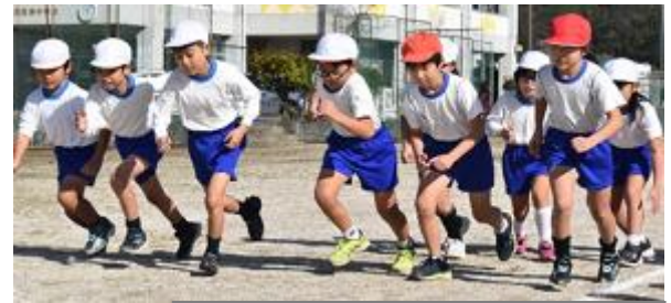
持久走大会 中学年スタート