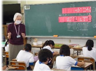
【3年生】 手をつなごう 共生社会実現に向けて、講師を招いて点字の学習をしました。他にも手話等について学習しました。