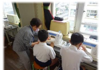
【5・6年生】 ミシンの使い方 ミシンボランティアの方のご支援により、6年生は、修学旅行で使うナップザックを製作しました。