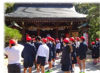
【6年生】 修学旅行 好天に恵まれ、萩・下関・美祿を巡る2日間。多くの学びがありました。生涯の思い出に残る行事です。