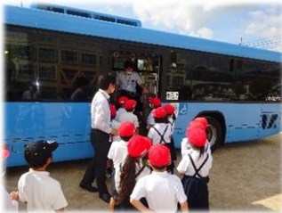
【2年生】 バスの乗車体験学習 バス2台を運動場に乗り入れていただき、模擬停留所を設置して乗降の体験等を行いました。