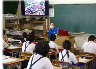
【4年生】 環境学習 4つの分野に分かれて、学習を進めています。今回は、講師を招いてフードロスについて学習しました。