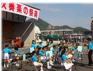
【金管バンド】 岩国祭参加 3年ぶりの岩国祭で演奏しました。練習の成果が感じられる素晴らしい演奏でした。