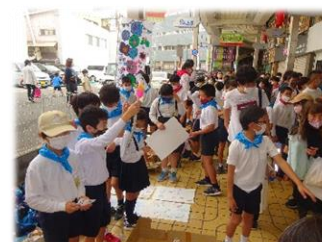
【5年生】 岩国祭参加 軽トラ新鮮組に初参加しました。大盛況となりました。地域を見つめ直す学びを継続しています。