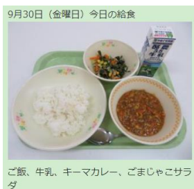
9月30日（金曜日）今日の給食 ご飯、牛乳、キーマカレー、ごまじゃこサラダ